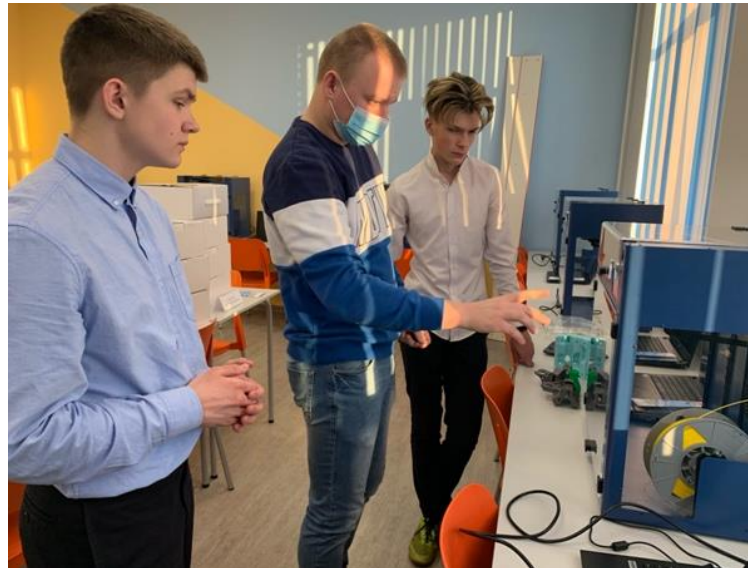
АО «Концерн ВКО «Алмаз-Антей» (профорientационная деятельность, конкурсное движение, целевое обучение в БГТУ «Военмех» им. Д.Ф. Устинова)