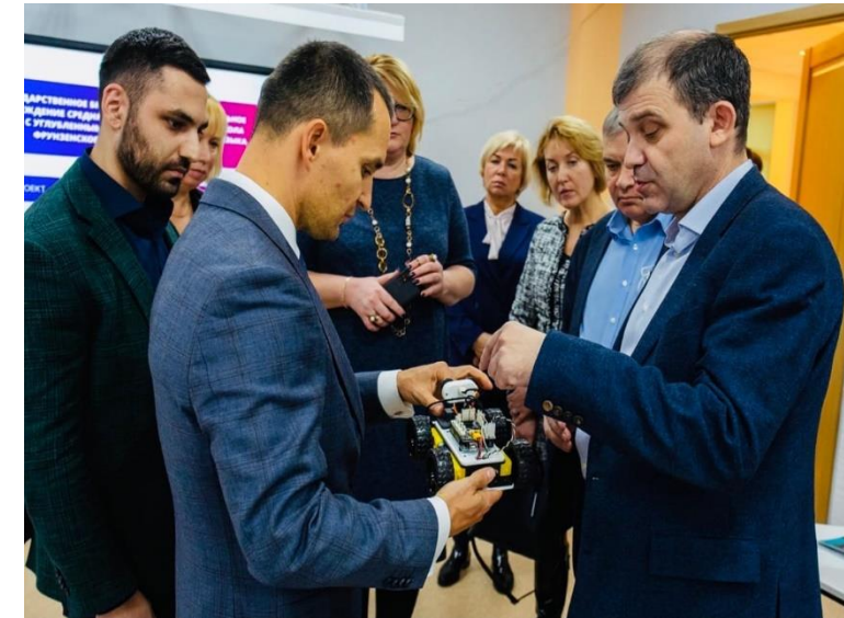
Санкт-Петербургский государственный морской технический университет (в рамках исполнения указания Президента Российской Федерации и соглашения с Правительством Санкт-Петербурга по открытию профильных инженерных классов по направлению «судостроение»)